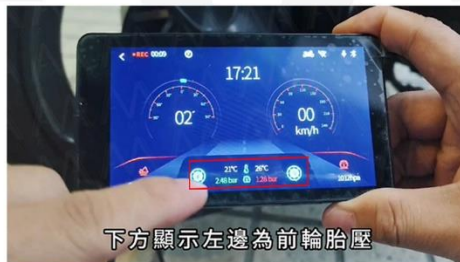
下方顯示左邊為前輪胎壓