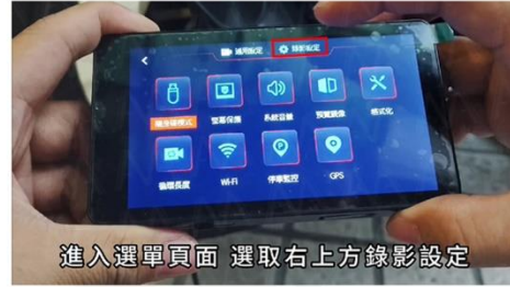
進入選單頁面 選取右上方錄影設定