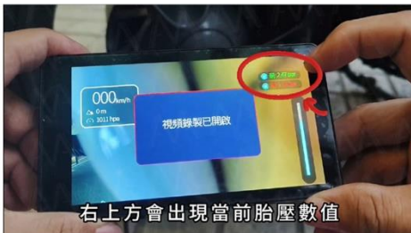
右上方會出現當前的胎壓數值