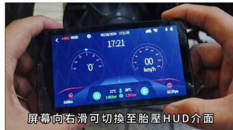
螢幕向右滑可切換至胎壓HUD介面