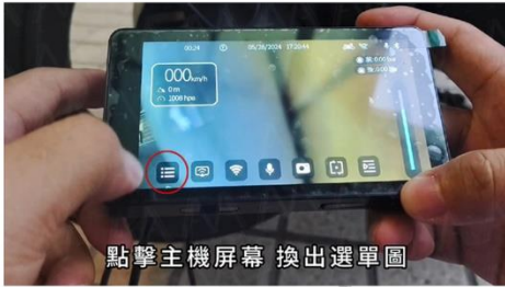
點擊主機屏幕 換出選單圖